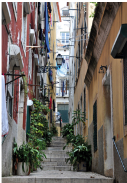
▲ Uliczki Alfamy

Portugalskie kobiety, podobnie jak w Bairro Alto, godzinami przesiadują w oknach, plotkując i obserwując przechodniów. Mężczyźni zbierają się w barach, gdzie dopełniają rytuału całodziennej cafezinho (picie „kawusi”) i gry w domino. Turyści natomiast udają się do Alfamy posłuchać fado – w dzielnicy znajduje się bardzo wiele kafejek i restauracyjek, w których odbywają się koncerty na żywo. Dla wielu mieszkańców stolicy Alfama to dusza Lizbony. Położone blisko siebie kamieniczki i wspólne